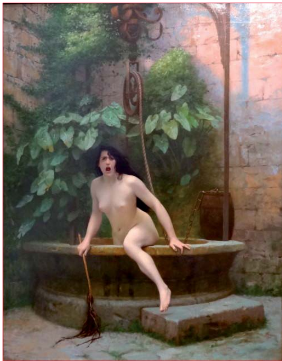
Figura 2. Jean-León Gérôme. La verdad saliendo de su pozo para avergonzar a la humanidad , 1896. Museo Ann de Beajeu, Moulins, Francia.

La verdad, una vez más sin ropajes como es la auténtica verdad, sale del pozo con un látigo en la mano dispuesta a castigar al mundo por haberla mantenido oculta desde... La pintura alude a la frase de Demócrito: “ La verdad está enterrada muy profundamente (...) nada cierto conocemos ”.