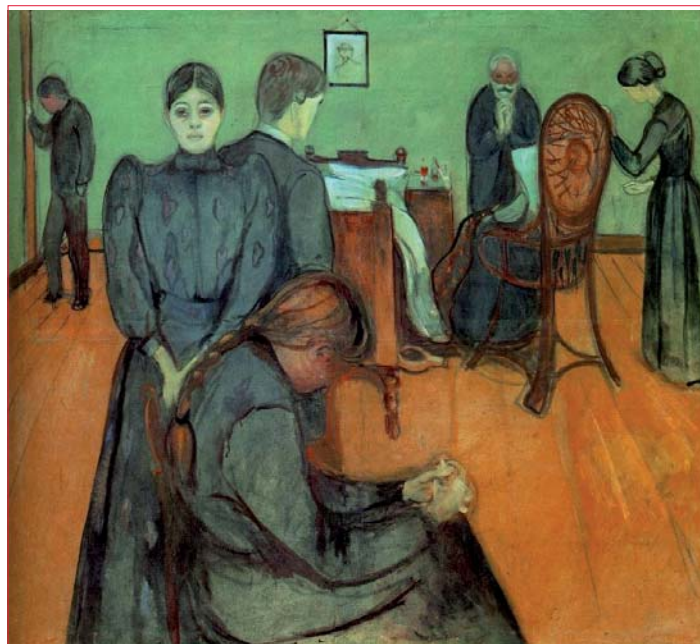
Figura 4. Edvard Munch. Muerte en la habitación (1895). Nasjonalgalleriet, Oslo, Noruega.

Es la forma en que el artista, maestro en la pintura de emociones, vio la muerte de su hermana preferida, Sophie, a causa de tuberculosis. El duelo y la congoja dominan la escena, no parece haber espacio para la duda o el reproche. La muerte aún no estaba revestida de posverdades.