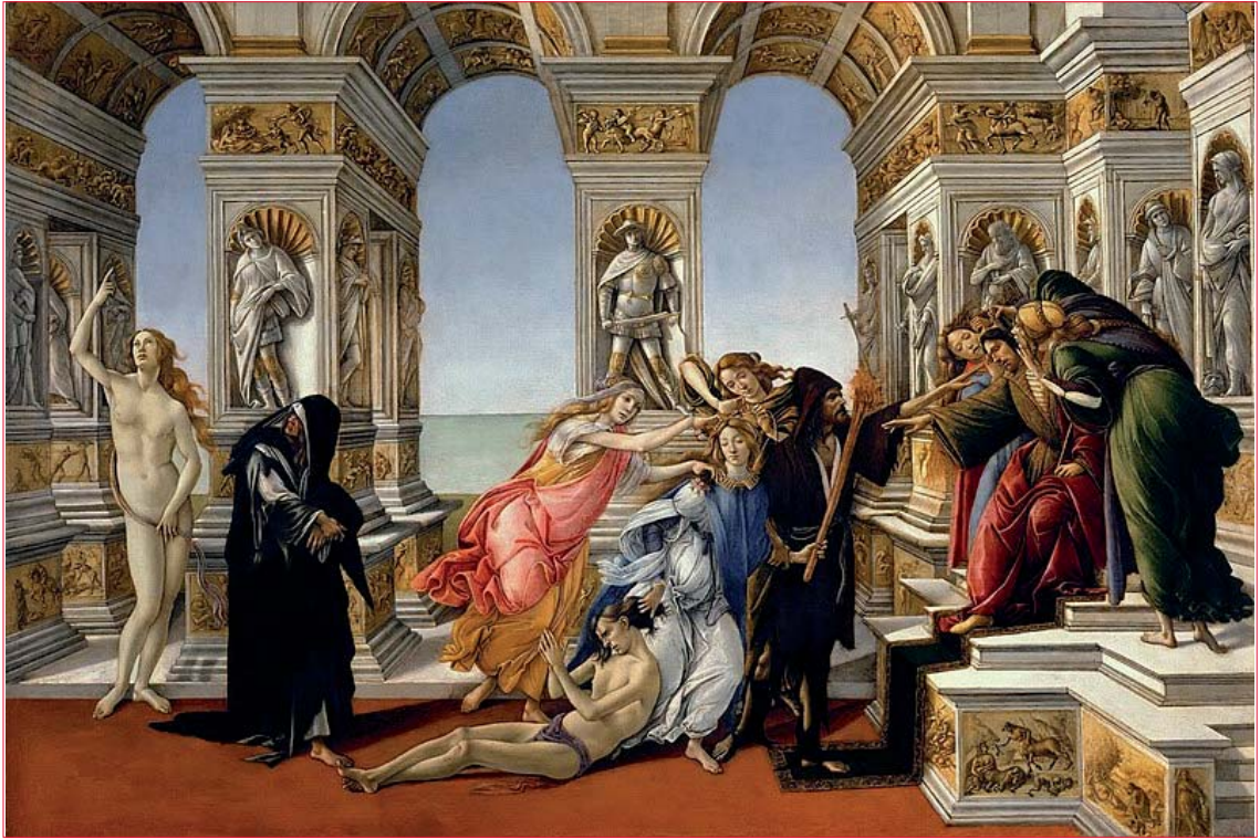
Figura 1. Sandro Botticelli. La calumnia de Apeles , 1495. Galería Uffizi, Florencia, Italia.

La verdad aparece en el extremo izquierdo del cuadro, desnuda (como siempre), señalando el cielo y olvidada, ignorada. Solo la penitencia, vestida de negro y andrajosa, se da vuelta para mirarla. Los otros personajes del cuadro son, en el extremo derecho y encima del podio, el rey Midas, el juez malo, con orejas de asno, secundado por la ignorancia y la sospecha que les susurran malos pensamientos a sus oídos. La víctima, en el suelo y desnudo, implora clemencia o justicia, mientras es arrastrado del pelo por la calumnia, que en la otra mano lleva una antorcha aludiendo a la rápida propalación que la caracteriza. Está secundada por el fraude y la envidia. La figura masculina que se encuentra delante del rey vestido de monje es el rencor.